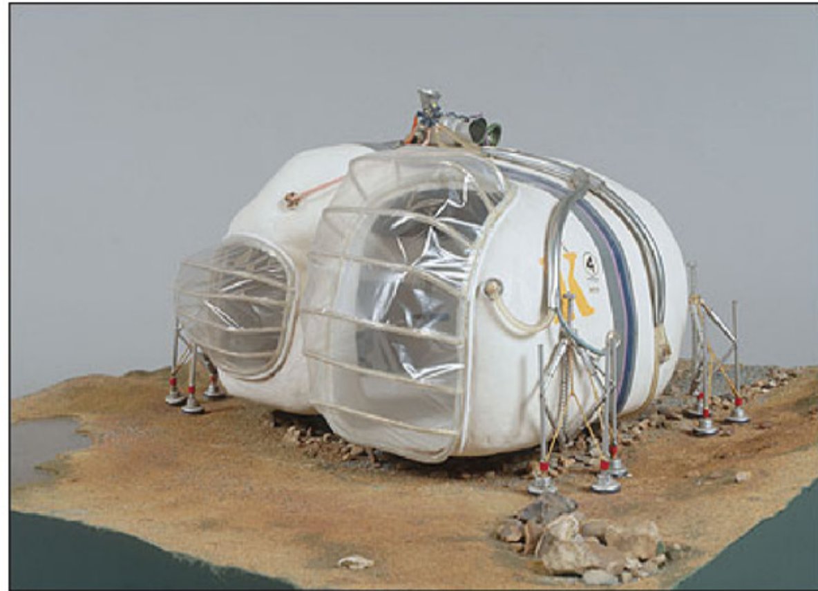
LIVING POD: PROPUESTA FUTURISTA DEL GRUPO ARCHIGRAM. DAVID GREENE PROYECTÓ EN 1966 ESTA PROPUESTA DE VIVIENDA TRANSPORTABLE DE ALTA TECNOLOGÍA, CLARAMENTE INSPIRADA EN NAVES ESPACIALES.