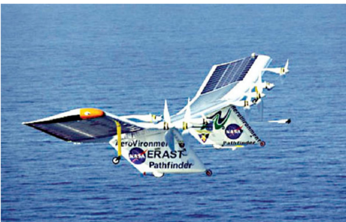
PATHFINDER: AVION SOLAR DESARROLLADO EN LOS PRIMEROS AÑOS '80 POR LA NASA, CAPAZ DE VOLAR SIN OTRA PROPULSIÓN QUE LA ENERGÍA SOLAR. EN 1998 BATIÓ EL RECORD DE ALTITUD PARA ESTE TIPO DE AVIONES EN MÁS DE 26.000 METROS.